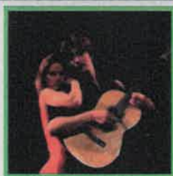
« World Fusion »

Guitares acoustiques et électriques - Instruments du Monde - Voix - Danse Contemporaine -